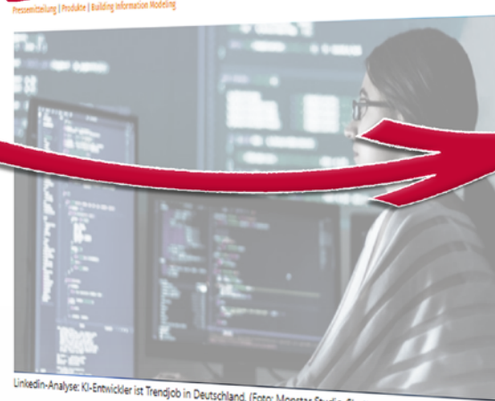
LinkedIn-Analyse: KI-Entwickler ist Trendjob in Deutschland.

Gute Neuigkeiten für unsere Kunden: Ab sofort stellen wir „Building Information Modeling“-Daten (BIM) für Akteure und Messwerte online zur Verfügung. Unsere Kunden können die Daten als Grundlage für die digitale Planung von Neubau- und Modernisierungsprojekten in allen gängigen Dateiformaten auf Deutsch und Englisch abrufen – und damit nachhaltiger und kosteneffizienter werden.